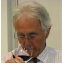
アンソニー・ハンソン氏

元マスター・オブ・ワイン会長、現クリスティーヌワイン部長であり、ブルゴーニュに関する多くの著書があり、ブルゴーニュワインの権威である。